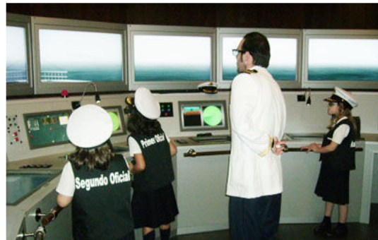
Puente de mando de la réplica del 'Sovereign'.

En una jornada de puertas abiertas para las familias, celebrada el pasado viernes, los animadores del Sovereign mostraron a padres e hijos, en una paseo de unos 40 minutos, las tareas que se realizan en un crucero.